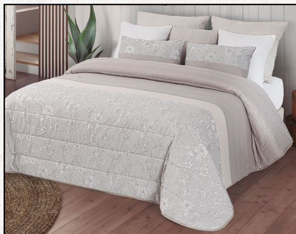
spring 45 (cinza)